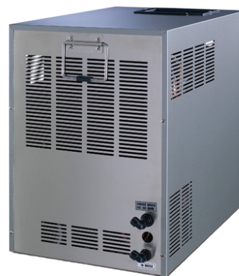
Niagara IN 120 WG Refroidisseur sous-évier