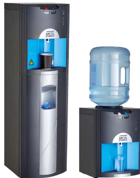
ArcticStar 55 avec chauffe-eau haute performance jusqu'à 95/96 °C

PS Certaines entreprises préfèrent échanger la fontaine à eau et effectuer le détartrage dans leur atelier, ce qui est souvent plus rapide et évite les problèmes potentiels de santé et sécurité chez les clients.