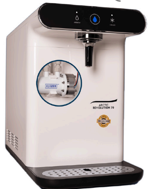
ArcticRevolution 70CL KLARAN