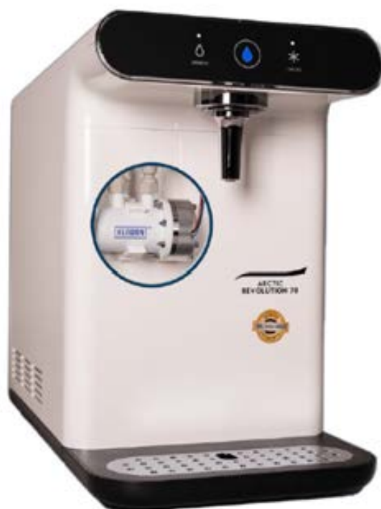
ArcticRevolution 70 KLARAN