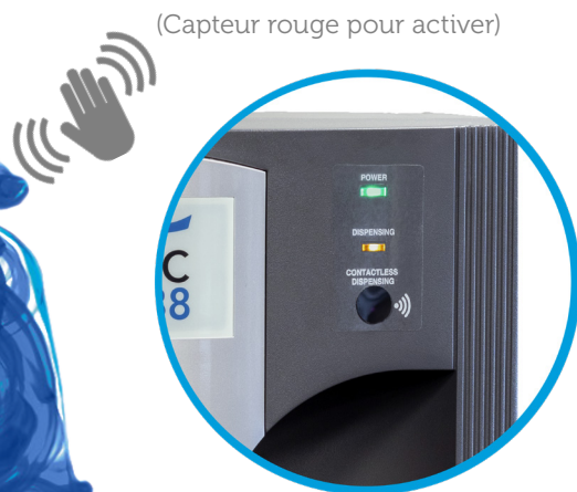
(Capteur rouge pour activer)

Mise à niveau de la distribution sans contact avec désinfection KLARAN