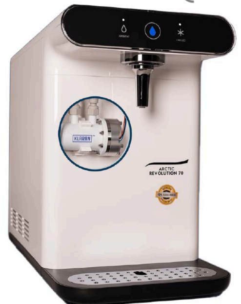
ArcticRevolution 70CL KLARAN