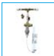
Rail d'installation avec filtre en ligne FILTER XL.