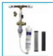
Rail d'installation avec boîtier de filtre vert et bougie de filtre à charbon vert ou bougie de nanofiltre vert.